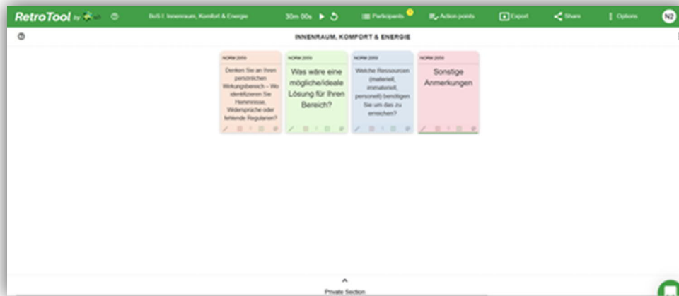
Abb. A- 2 Digitales Flipchart zur Dokumentation des Workshops

Nach 30 Minuten wechselten die TeilnehmerInnen in einen anderen Themenbereich, sodass am Ende des Workshops alle Teilnehmer*innen jeden Themenbereich absolviert haben. Die Dokumentation in den BoS hat über ein digitales Flip-Chart stattgefunden 4 . Die digitalen Flipcharts mit den oben angeführten drei Leitfragen wurden vorab vom Norm2050 Team vorbereitet. Zu jeder dieser Fragen waren die Teilnehmer*innen aufgefordert, digitale Post-Its zu verfassen und diese mit allen anderen Teilnehmer*innen der BoS zu teilen bzw. zu diskutieren. Jede Session wurde durch projektinterne Teammitglieder moderiert. Abb. A-2 zeigt das eingesetzte digitale Flipchart.