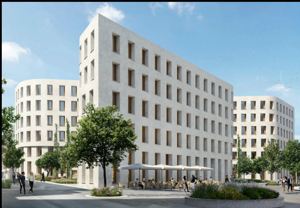
© Entwurf: Baumschlagler Eberle Architekten / 2260 GmbH

Österreichische Gesellschaft für Nachhaltiges Bauen